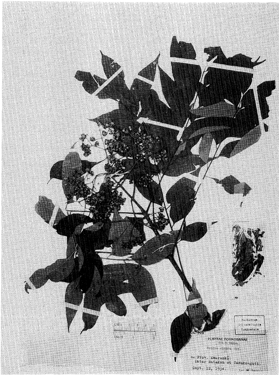
Fig. 2. Euodia taiwanensis Yamazaki. Type.

carpels globose-ellipsoid, ca. 3 mm long, 2.5 mm wide, tuberculate outside, densely short-pilose inside, one-seeded. Seeds globose-ellipsoid, ca. 2 mm long, 1.5 mm across, lustrous, black.