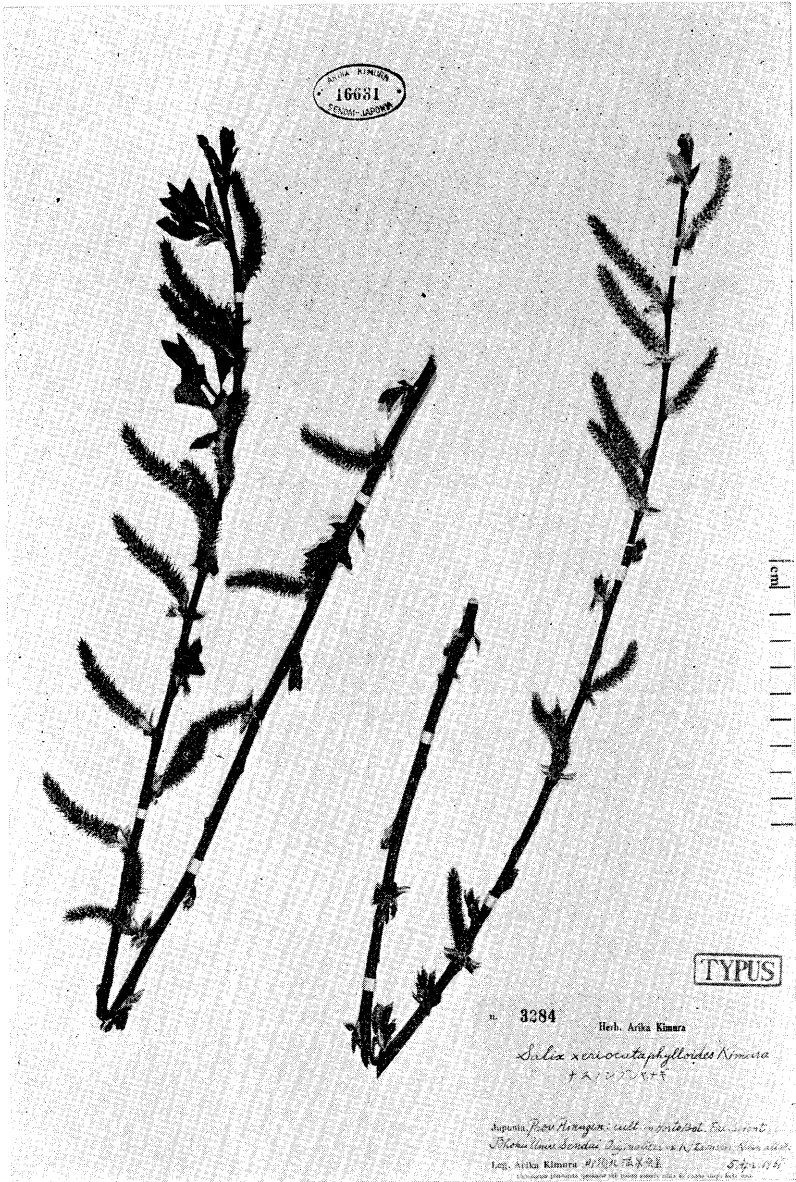
Fig. 1. Salix xerictaphylloides Kimura. Ramuli amentis ♀ ornati. Holotypus.