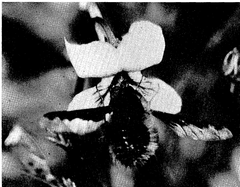
Fig. 2. Bombylius major sucking nectar from a flower of V. rostrata var. japonica .

を回して上弁に移り、上から花の中をのぞきこむような姿勢で、雌雄蕊を抱え込んで花粉を採取していた。いわゆる胸面受粉の姿勢である。捕らえて観察したところでは、後肢の花粉バスケットに最も多く花粉がみられ、次いで直接雌雄蕊に接する胸部前半の腹面および顔面に多かった。