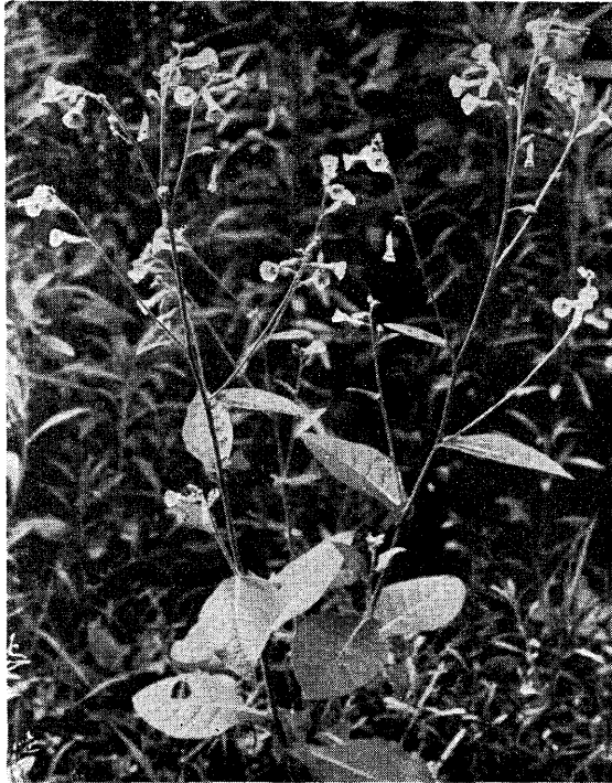
Fig. 1. Nicotiana trigonophylla Dunal in full bloom, on open waste site around University Museum, University of Tokyo, Hongo, Tokyo. (Photographed by Y. Asai on Jun. 20, 1972.)

本種は全草が淡緑色を呈し、Fig. 1 のように直立、多少分岐する1年草（原産地では多年草にもなるという）で、草丈 1 m 内外にも達する。全株に本属特有の腺毛を密布するため粘着する。葉は互生し、栽培品のタバコに較べて質が薄く全辺。下部の葉