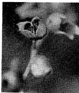
Fig. 3. Capsules with matured seeds of Nicotiana trigonophylla Dunal.