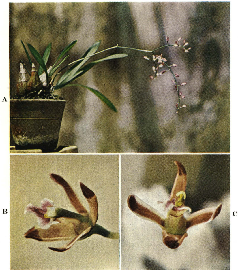
T. TUYAMA : Himalayan orchid