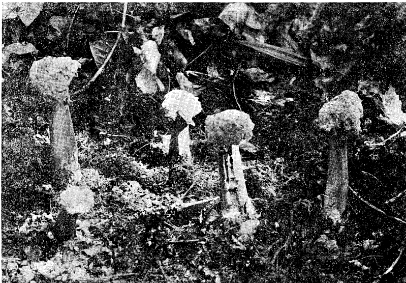
Fig. 1. Six fruitbodies in the forest of Namase, Daigo-machi. (Photo. M. Suzuki; Oct. 5, 1955).