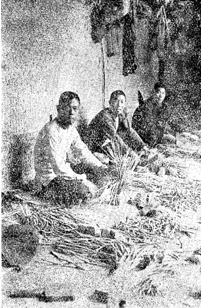
原産地カラ到着シタ黄耆ヲ 選別シ束ネル