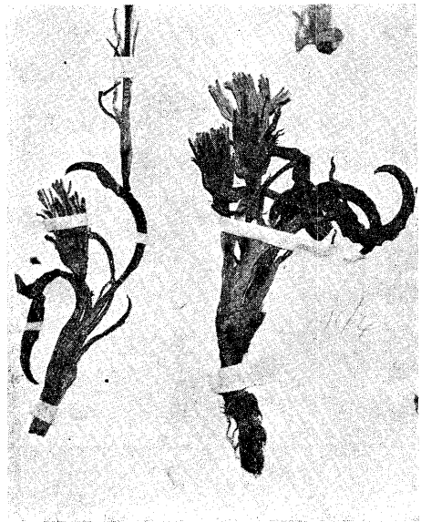
たらばらもんじん