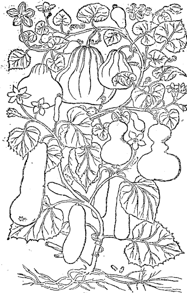
第 2 圖

Syn. Cucurbita lagenaria minor TABERNÆMONTANI