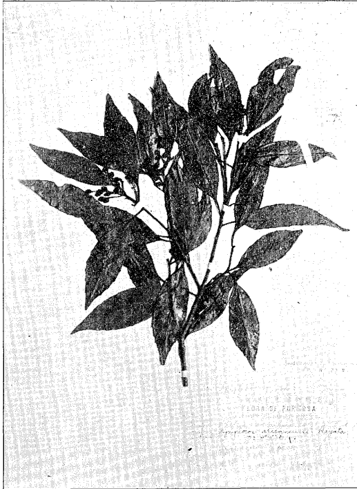
Fig. 1. Simplocos taririkensis MORI.

Kunihiko MORI: A description of Simplocos taririkensis sp. nov. from Taiwan.