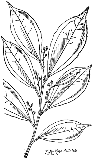
T. Makino deliniat.

本來烏藥ト云フ漢藥ハ昔時健胃藥トシ或ハ中風ニ用ヒ又霍亂ヲ治スルニ用タモノデアアルガ其確實ナル効力ハ本日デハ今一度ヤリ直シテ研究シテ見ネバ分ラナイノデアアル、此烏藥ハ普通ハ天台烏藥ト云フモノデ樟科ノ植物 Lindera strichnifolia Vahl. ノ根デアル、其根ノ膨脹シテさつ々芋ノ如キヲ括樣ト云ヒ圓擲形ノ品ハ榛樣ト稱シ劣等品トシテアル本草綱目啓蒙ニ「享保年中漢種二品渡ル天台烏藥ト衡州烏藥トナリ傳へ裁テ今花戸ニ多シ云々」トアリ又日用藥品考(文化七年)ニ「天台烏藥、衡州烏藥ノ